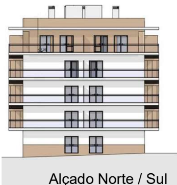
Alçado Norte / Sul